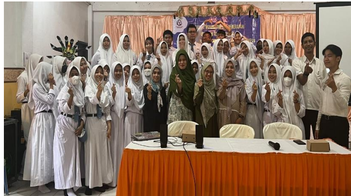
Gambar 2. Sebagian Peserta