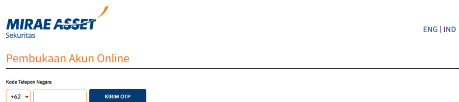
Gambar 5 Langkah Awal dalam Pembukaan Rekening (Sumber : https://open.miraeasset.co.id/openaccount )

Pada proses ini peserta yang telah terpilih langsung dipraktikan dan dibimbing dalam pembukaan rekening. Pembimbingan ini juga berlanjut melalui online atau grup wa sebagai media koordinasi antara narasumber, peserta, dan dibantu juga langsung oleh salah satu pegawai sekuritas. Antusiasme peserta dapat dilihat dari banyaknya pertanyaan-pertanyaan yang terlontar dalam sesi tanya jawab sehingga terjadi interaksi yang aktif antara peserta dan pemateri. Diharapkan dari kegiatan ini mahasiswa dapat mengedukasi diri sendiri dan orang-orang disekitarnya tentang apa itu pasar modal.