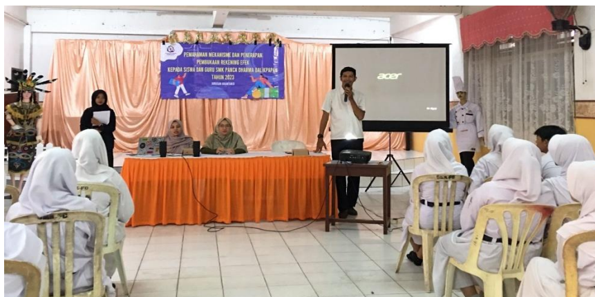
Gambar 1. Pengarahan dari Guru SMK Panca Dharma

Kegiatan dilaksanakan sesuai dengan rencana yaitu hari Senin, tanggal 5 Juni 2023. Kegiatan di laksanakan mulai jam 8 pagi dimulai dari registrasi sampai jam 12 siang yaitu kegiatan pembukaan rekening dan penutup.