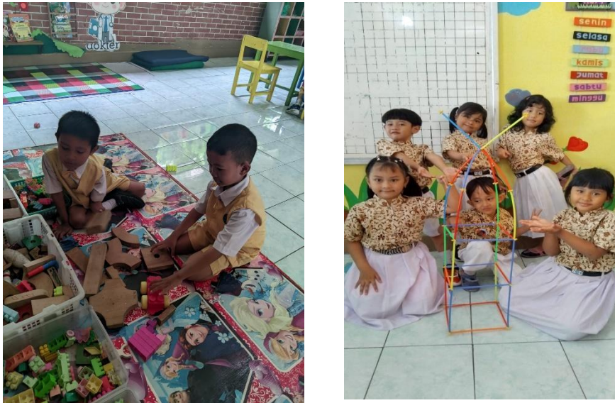
Gambar 3. Kegiatan PKM

Beberapa jenis APE yang ditemukan pada jenjang sekolah PAUD adalah APE yang sudah jadi (telah tersedia ditoko-toko alat tulis), seperti misalnya balok kayu, permainn pasir, Puzzle, bola-bola kayu, , dan aneka mainan lainnya yang mudah dijangkau. Namun, ternyata menjadi kendala terkait pengadaannya bagi di sekolah-sekolah PAUD karena harganya yang mahal. APE yang telah tersedia digunakan kebanyakan sudah sangat usang dan terbatas dalam jumlah. Pelatihan ini dapat memenuhi tuntutan guru PAUD seperti saat ini, yaitu memiliki kemampuan untuk mengajar kepada peserta didik dan mampu menjadikan pembelajaran menjadi berkesan sehingga dapat mengembangkan aspek- aspek perkembangan pada anak usia dini. Adapun capaian kegiatan pelatihan ini disajikan pada Gambar 4 .