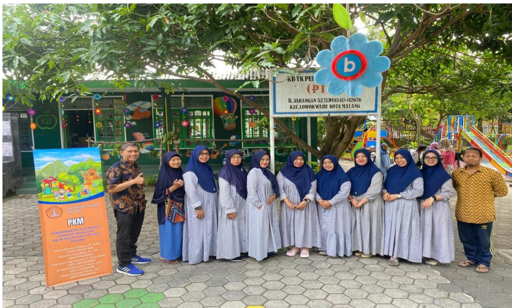
Gambar Error! No text of specified style in document.. Kegiatan PKM