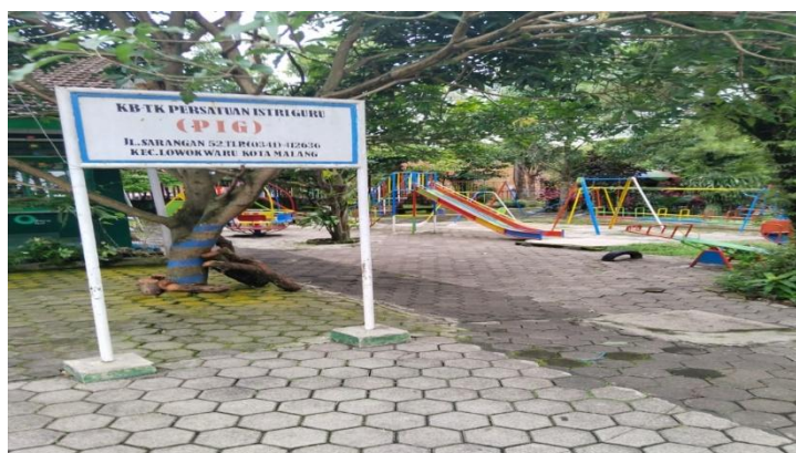
Gambar 1 KB-TK PIG

Pengabdian kepada masyarakat (PKM) ini dimaksudkan untuk melatih pembuatan dan pemilihan APE PAUD bagi para guru KB-TK PIG di Kelurahan Lowokwaru, Kecamatan Lowokwaru Malang. Program pendampingan dan pelatihan ini dilaksanakan dengan total guru PAUD sebanyak 8 Orang. Hasil analisis situasi menunjukkan bahwa kemampuan guru PAUD peserta PKM ini dalam mendesain pembelajaran dengan menggunakan APE hanya 20%. Kemampuan tersebut hanya dimiliki para guru yang berkualifikasi akademik S1/D4 atau yang mempunyai pengalaman kerja lebih dari 10 tahun meskipun sebagian dari mereka berkualifikasi akademik Sarjana non-PAUD. Hal tersebut menunjukkan pengalaman kerja membantu guru untuk mengembangkan kompetensi di bidang PAUD.