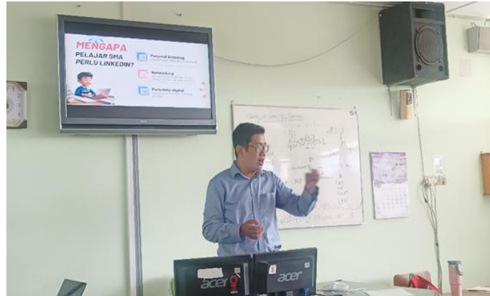
Gambar 3. Penjelasan materi menggunakan linkedin