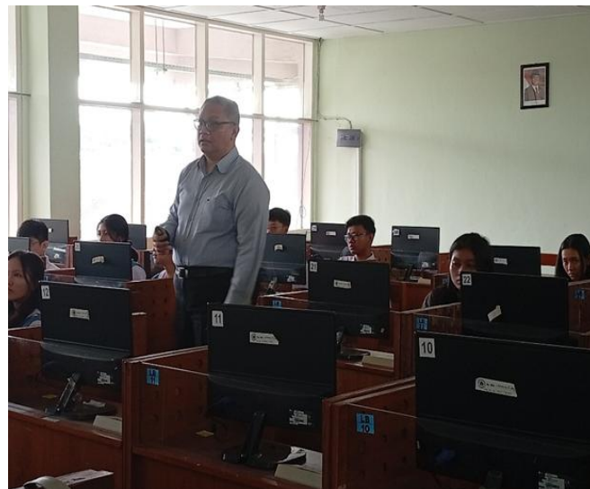
Gambar 4. Pemateri menjelaskan materi untuk para siswa