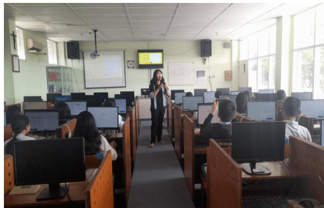
Gambar 2. Salah satu pemateri sedang menjelaskan materi

Dampak kegiatan juga dirasakan secara institusional. Pihak sekolah memperoleh model pelatihan yang dapat direplikasi sebagai bagian dari program pengayaan non-akademik, sehingga mendukung penguatan kompetensi siswa di luar kurikulum formal. Selain itu, program ini memperkuat kolaborasi antara universitas dan sekolah menengah, menciptakan ekosistem pembelajaran yang saling mendukung, khususnya dalam memperkuat literasi digital dan kesiapan karier generasi muda. Melihat hasil positif tersebut, pihak universitas dan sekolah bersepakat untuk melanjutkan program melalui beberapa tindak lanjut. Dengan pendekatan sustainable partnership ini, diharapkan program dapat memperkuat kapasitas sekolah dalam menyiapkan lulusan yang adaptif, literat digital, dan kompetitif di era global dan digital.